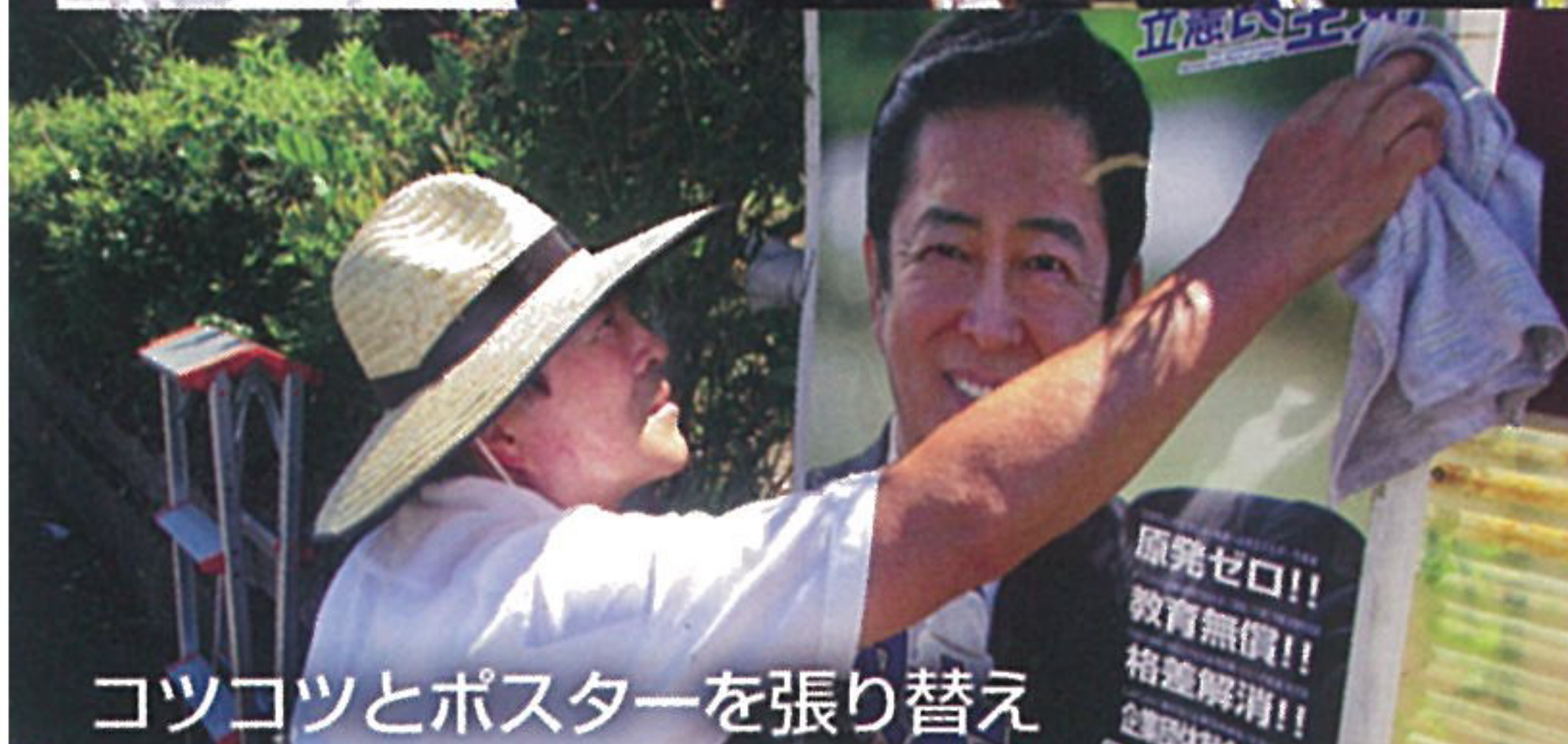
コツコツとポスターを張り替え