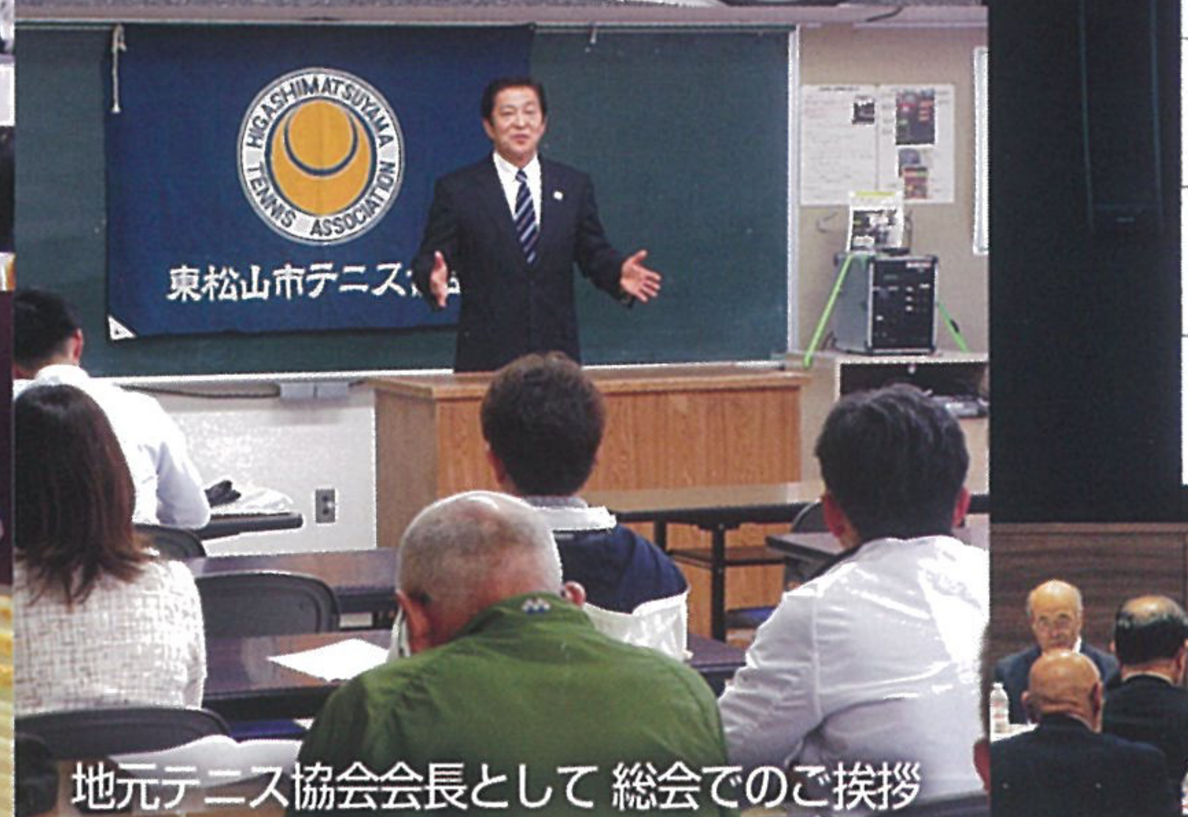
地元テニス協会会長として 総会でのご挨拶