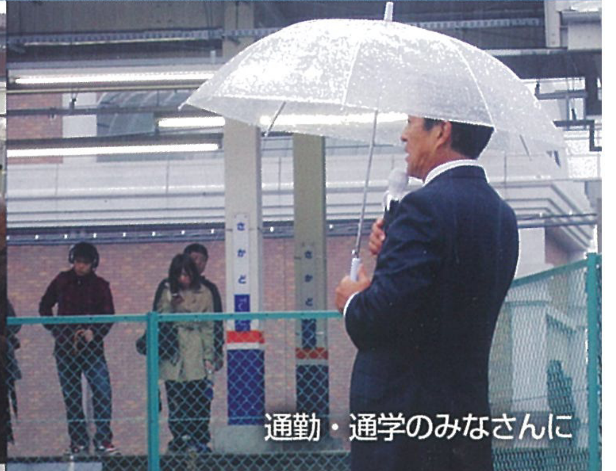
通勤・通学のみなさんに