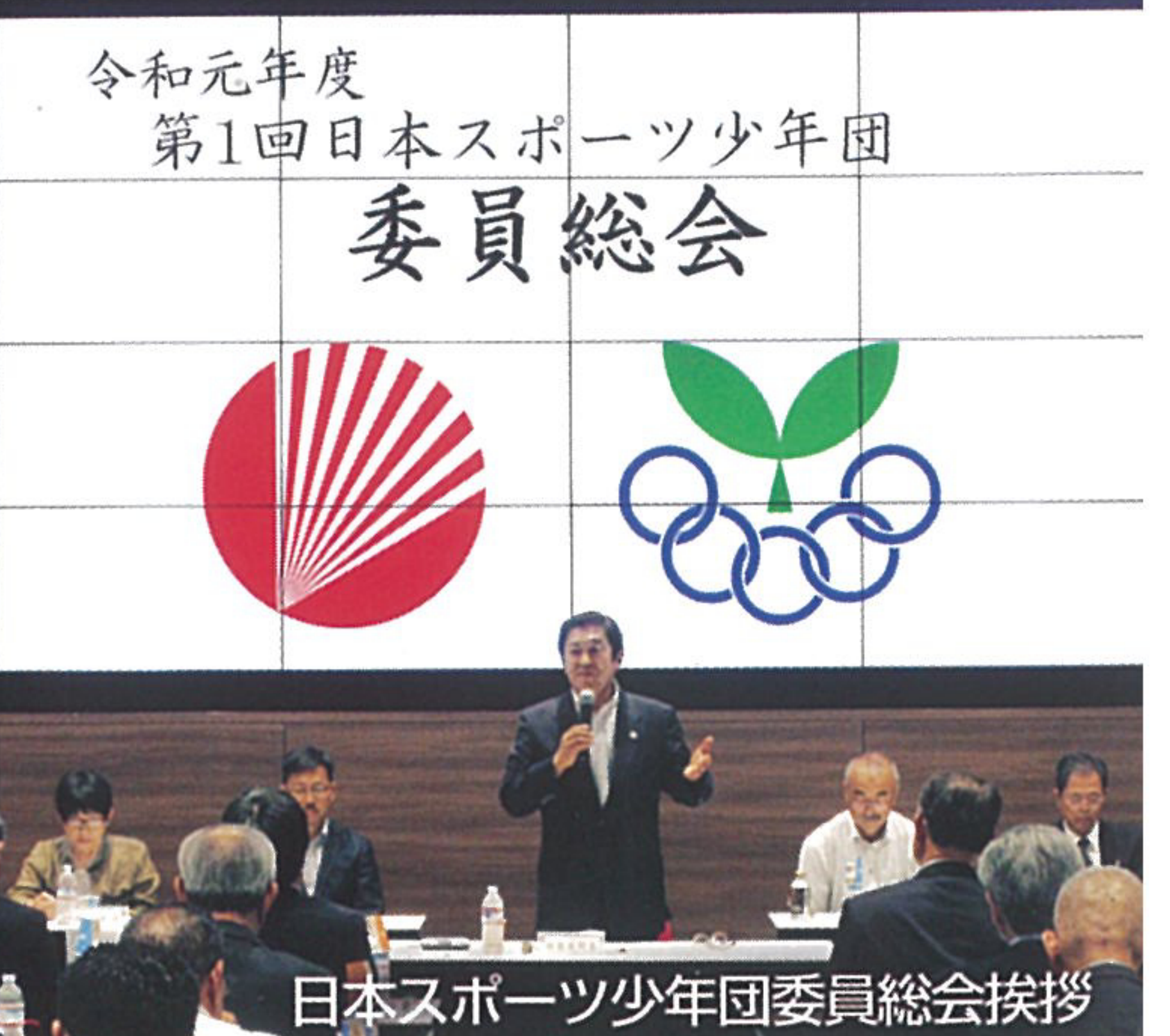
令和元年度 第1回日本スポーツ少年団 委員総会