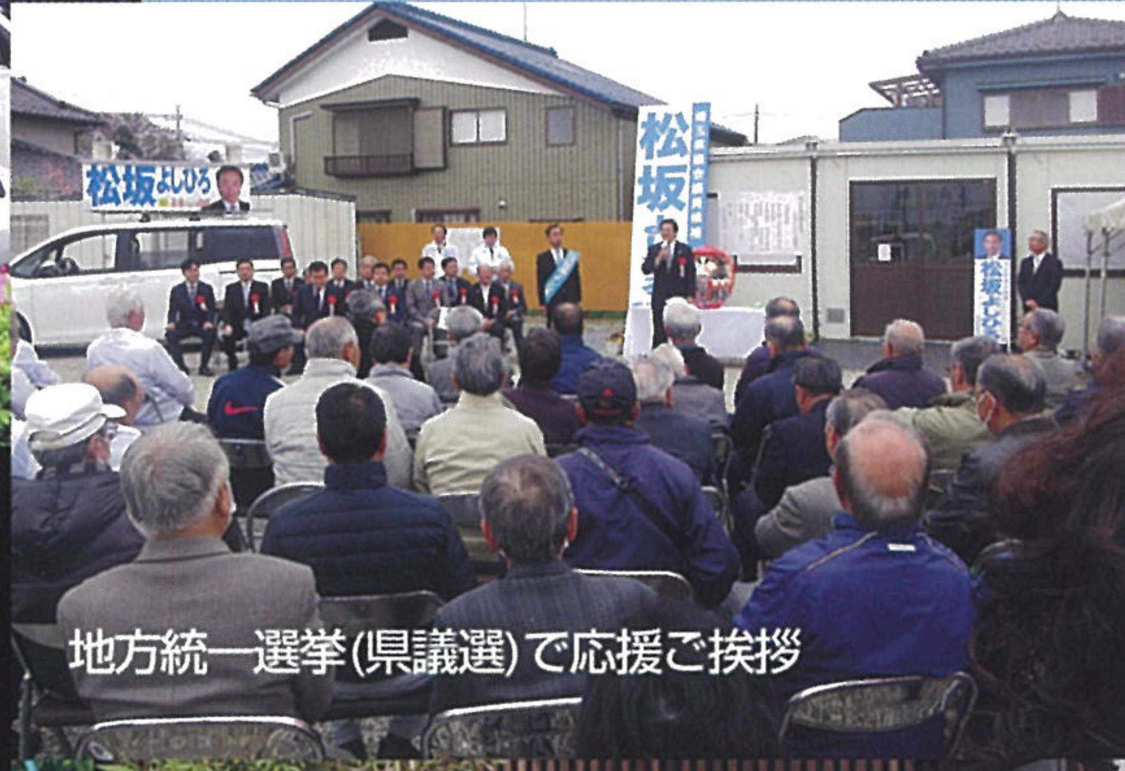
地方統一選挙(県議選)で応援ご挨拶