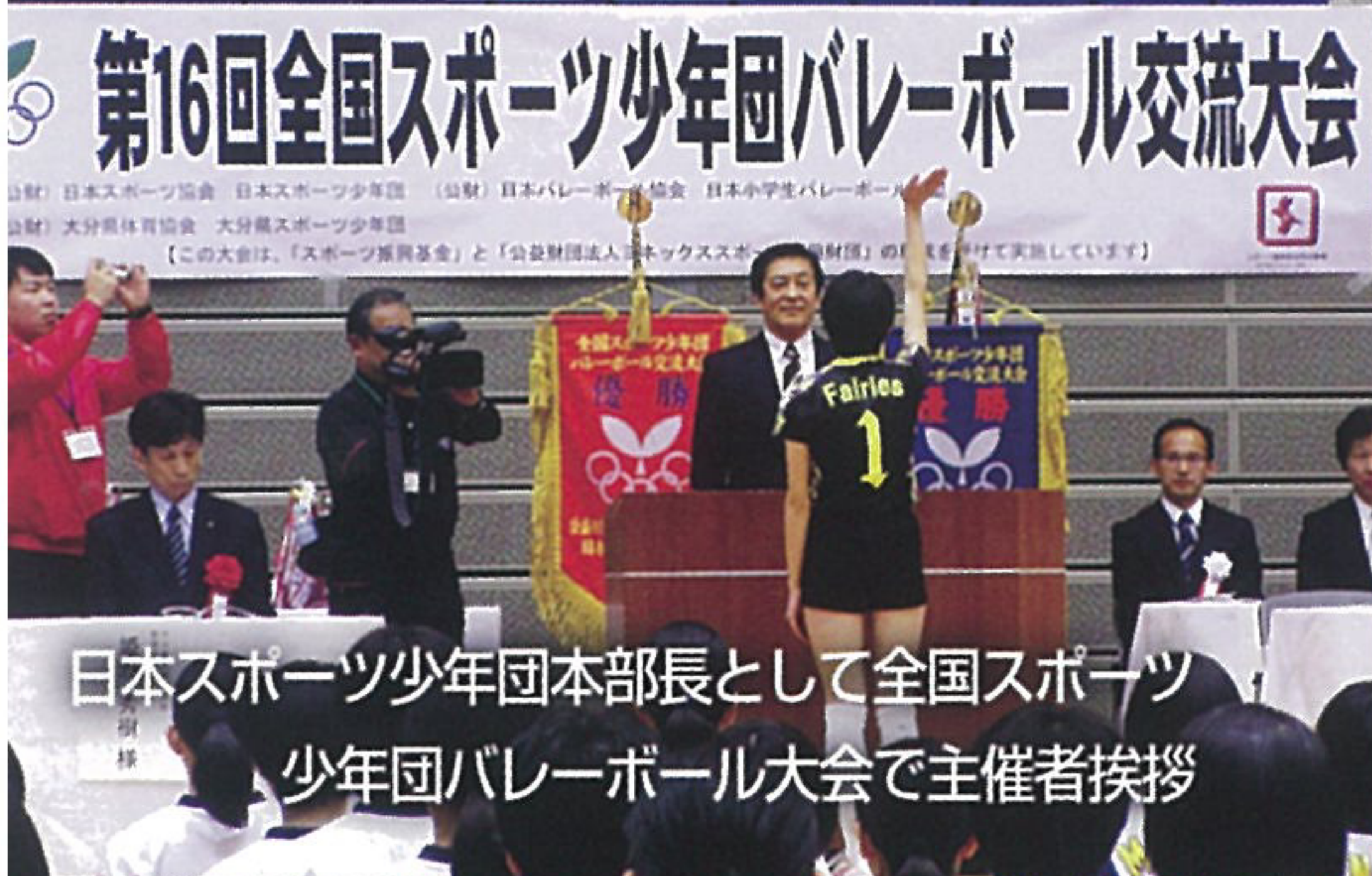
日本スポーツ少年団本部長として全国スポーツ少年団バレーボール大会で主催者挨拶