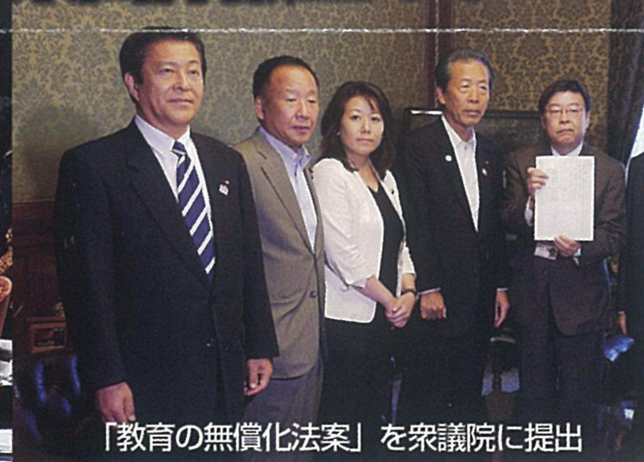
「教育の無償化法案」を衆議院に提出