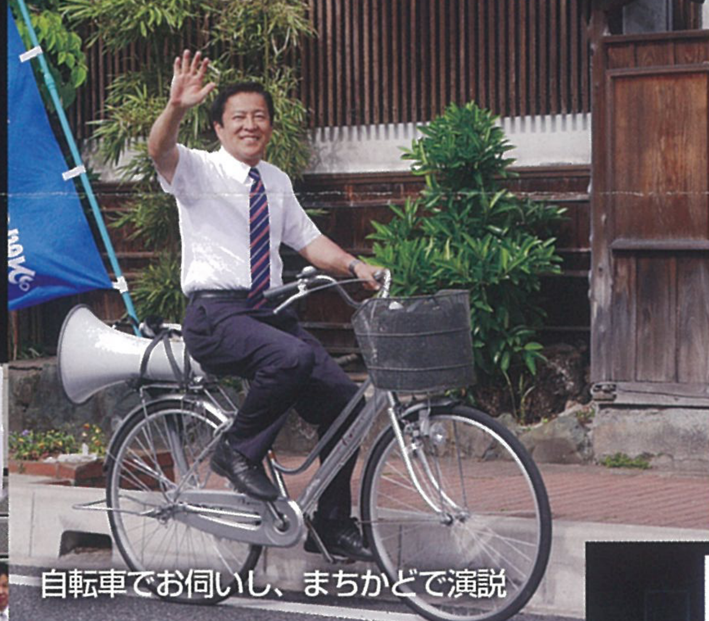
自転車でお伺いし、まちかどで演説