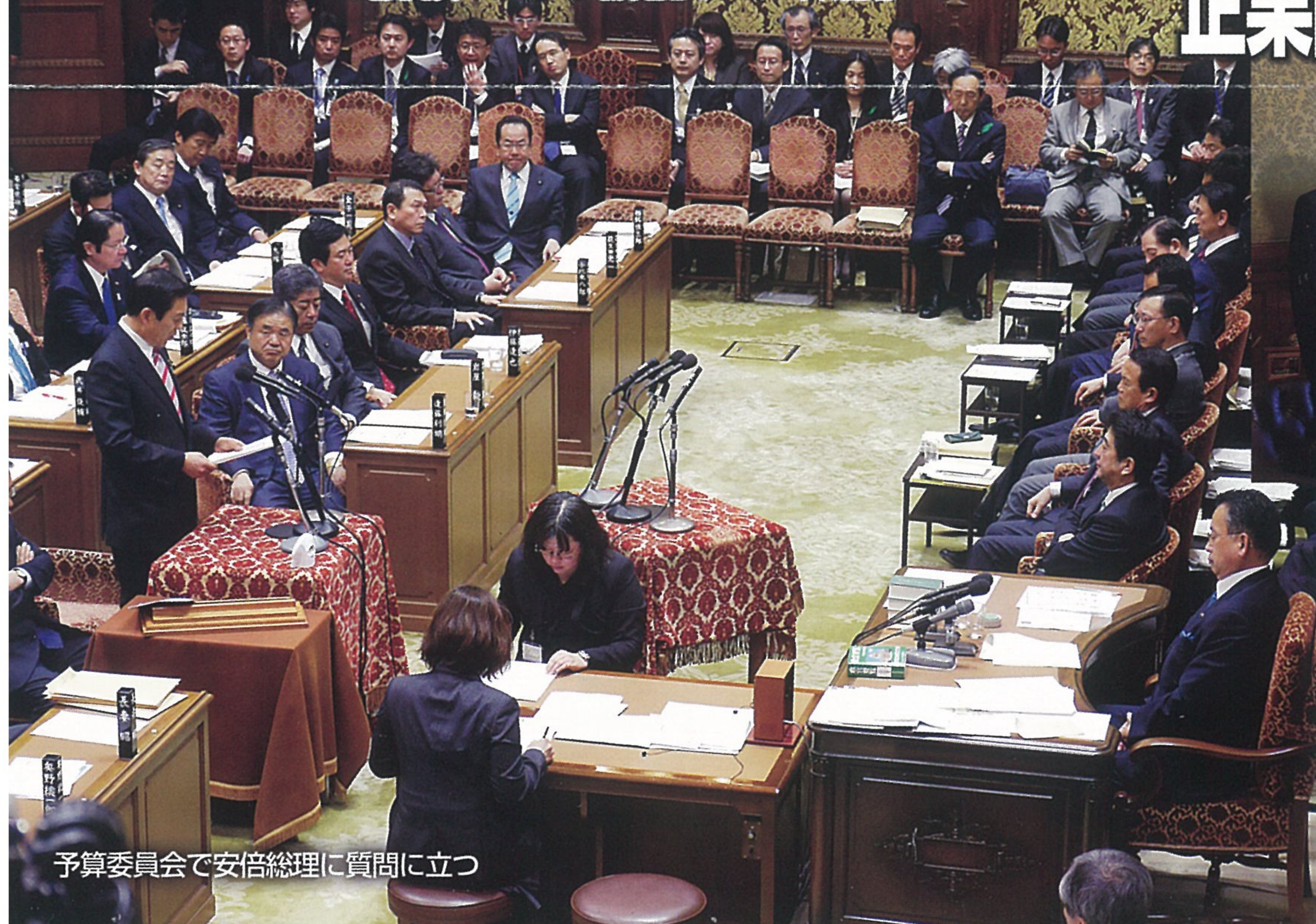
予算委員会で安倍総理に質問に立つ