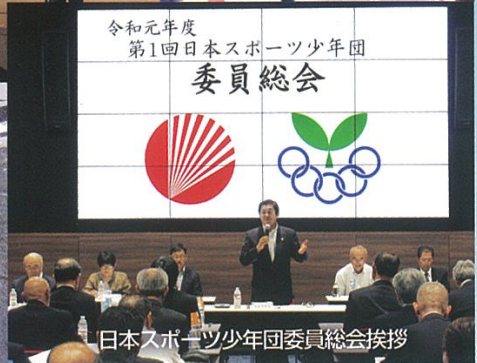
令和元年度 第1回日本スポーツ少年団 委員総会