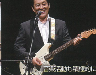
音楽活動も積極的に