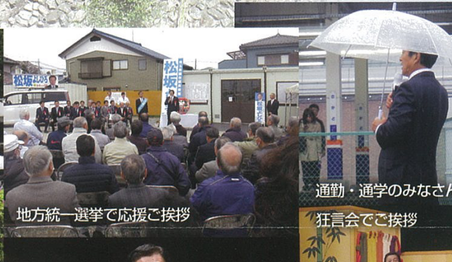
地方統一選挙で応援ご挨拶