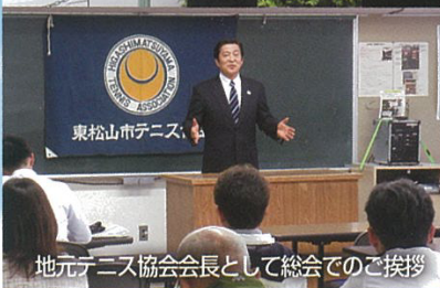
地元テニス協会会長として総会でのご挨拶