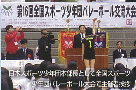
日本スポーツ少年団本部長として全国スポーツ 少年団バレーボール大会で主催者挨拶