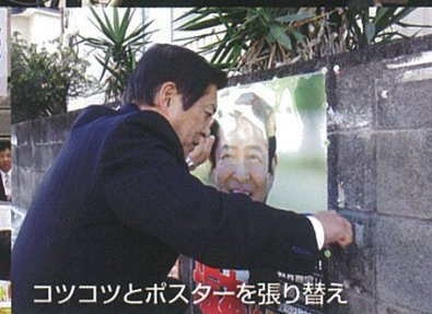
コツコツとポスターを張り替え