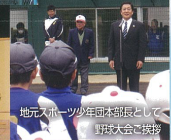
地元スポーツ少年団本部長として 野球大会ご挨拶