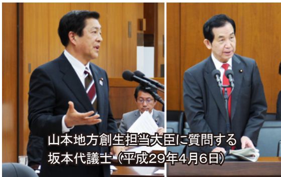
山本地方創生担当大臣に質問する坂本代議士 (平成29年4月6日)

4月6日、坂本代議士は「第7次地方分権一括法案」の質疑において、「今回の法案では、政府は国・地方の税財源配分や税制改正に関する提案等については、自治体からの提案募集を