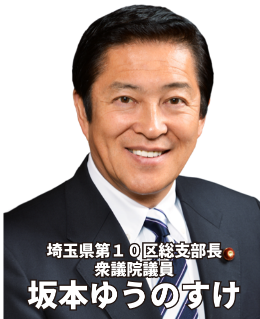
埼玉県第10区総支部長 衆議院議員 坂本ゆうのすけ

今後、与党に対し、本法案の次期国会での審議入りを強く求めるとともに、早期の成立に向け全力で取り組んでまいります。